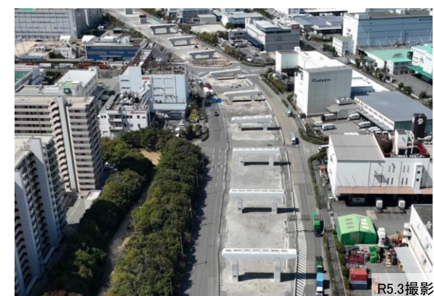
六甲アイランド地区