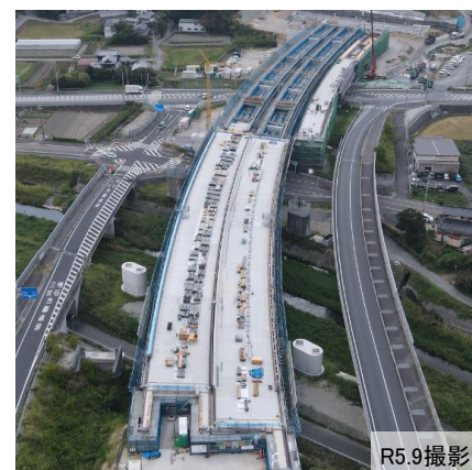
菅野高架橋 榎谷地区