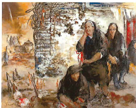
《紀行・ポルトガル》2001年 当館蔵