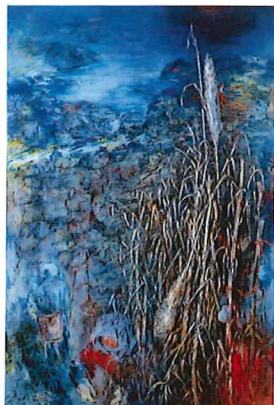
《島の畑に(六島)》1985年 当館蔵