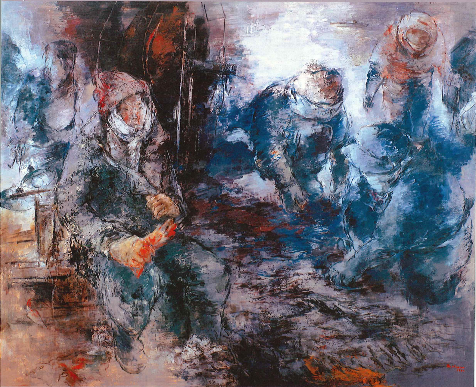
《渚の女たち(大毛島)》1980年 当館蔵