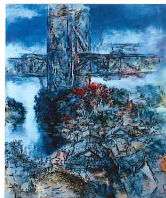
《架橋の島かげ(与島)》1987年 当館蔵