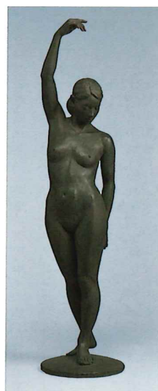
彫刻「秋に想ふ」岩谷誠久(特選)