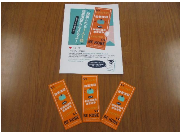
しおり型投票済証