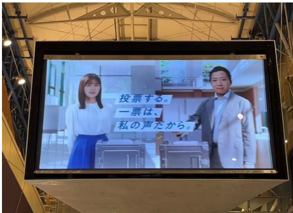
センター街BOSSビジョン