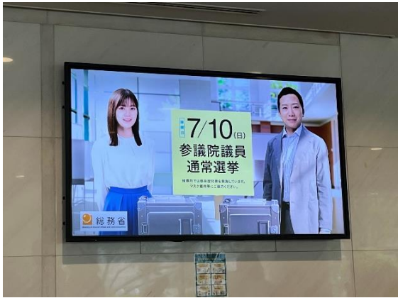
市役所1号館デジタルサイネージ