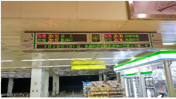
地下鉄駅電光掲示板