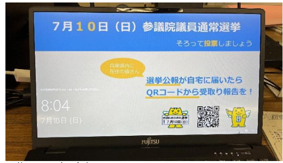
職員用事務処理PCスクリーンセイバー