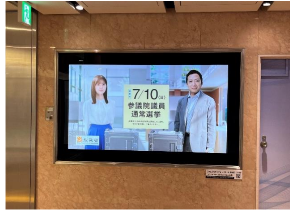
さんちかビジョン