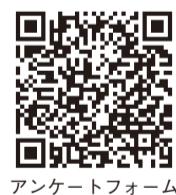
アンケートフォーム

「選挙公報」は、候補者のプロフィールや政見等を皆様にお知らせする大切な文書です。選挙公報を確実に有権者の皆様にお送りするため、ご協力をお願いします。