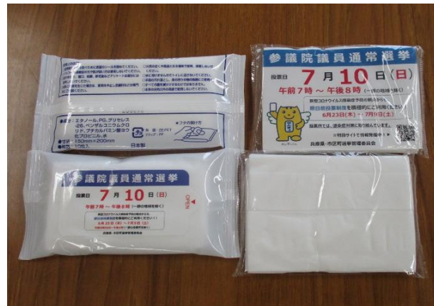
ウェットティッシュ・ポケットティッシュ