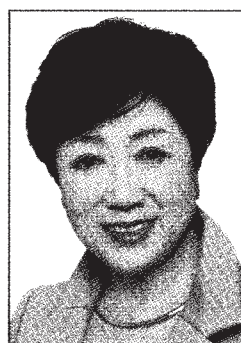
希望の党 代表 こいけ ゆりこ 小池 百合子