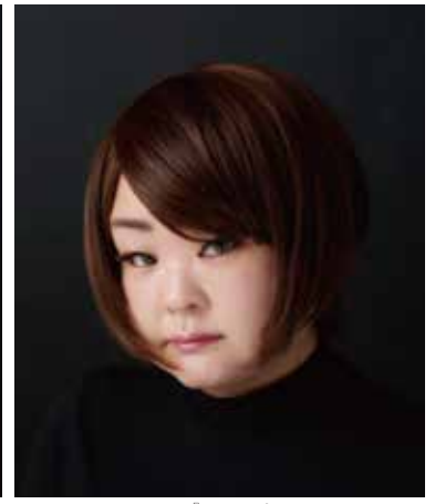
「BLOOM」 ©Tomoko Sawada