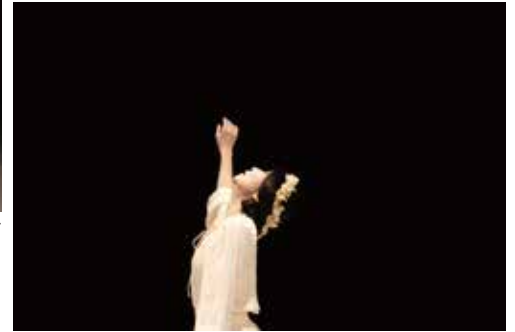
『Song of Innocence 無垢なるうた』2020年