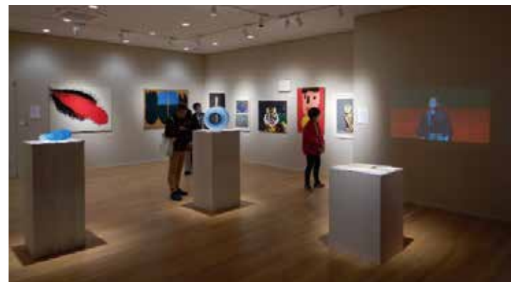
同会場での第15回長田文化賞受賞者展の様子

平成18年から始まった同賞はこれまで15回を数え、のべ40の個人・団体の方が各賞を受賞されています。