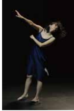
『迷い』 2014年