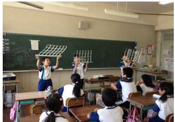
模型を使った実験