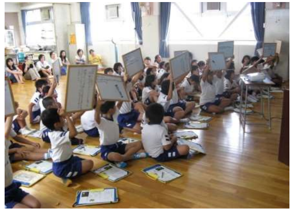
川の「楽しさ」「危険性」を学ぶ