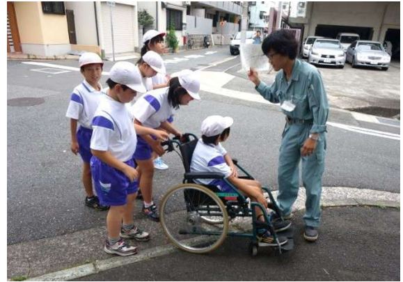
車いすでまちの探検