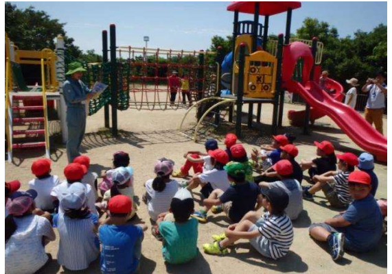
遊具の使い方を学ぶ