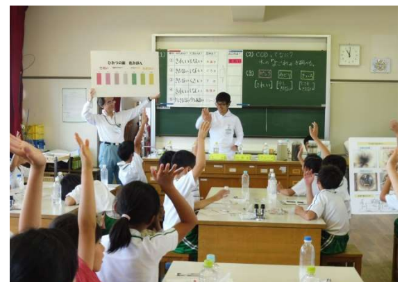
水の「よごれ」を調べる実験