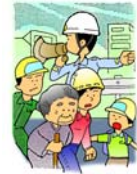
避難勧告や避難指示