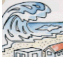
津波警報・注意報