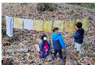
ピンクに染まる 予定だったのですが…