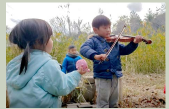
森の中でミニ演奏会