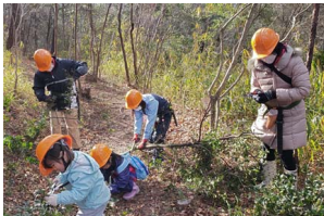
切った木を細かく刻んでいます