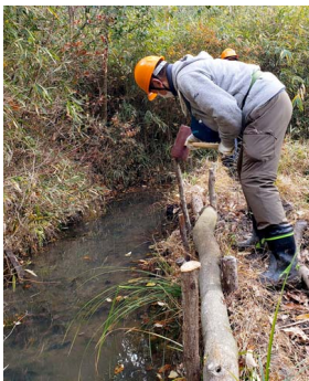
掛矢で杭を打ち込み

以前から手入れをしている水路が、イノシシに荒らされていたので、土手を杭で補強しました。