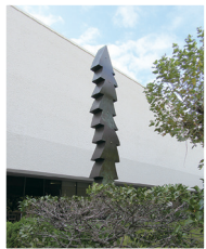
「スウィング86-02 (大空に向けて)」 渡辺豊重 1986