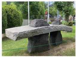
「イキハ・ヨイヨイ・カエリハ・コワイ」 最上壽之 1976