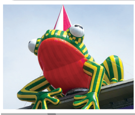
「Kobe Frog (愛称:美かえる)」 フロレンティン・ホフマン 2011