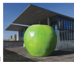
「青りんご」 安藤忠雄 2018