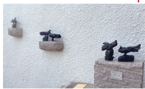
「道標・鳩」 柳原義達 1972-87