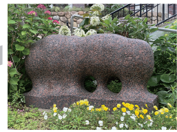
「風景(4) 森」 増田正和 1987