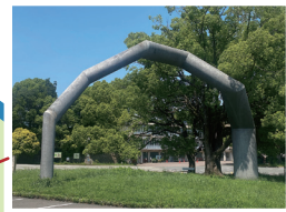
「OVALOLOGY」 松尾光伸 1978