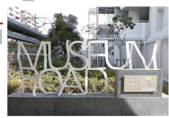
「ミュージアムロード」 サインモニュメント 榮元正博 2018