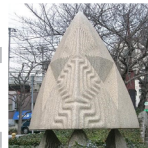
「パイプレーションII 歓喜」 北島一夫 1990