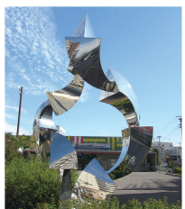
「風舞」 松永勉 1990