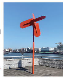
「遥かなリズム」 新宮晋 1979