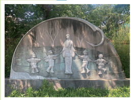
「夕鶴」 新谷英夫 1960