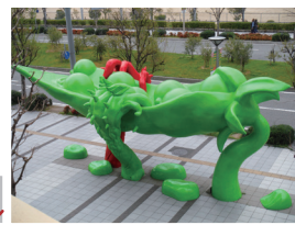
「PEASE CRACKER」 椿昇 2014