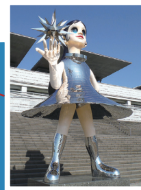
「Sun Sister(愛称:なぎさ)」 ヤノベケンジ 2015