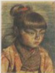
【内なる美】1915年 油彩、カンヴァス 縦47×横31.2cm 京都市立美術館蔵