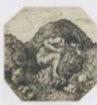
【天啓創造】1907年 油彩、カンヴァス 縦17×横13.2cm 京都市立美術館蔵

同時開催の『小磯良平作品展 Ⅱ』では、小磯良平が手がけた装丁原画も展示しています。彌生の装丁と小磯の装丁、彌生の写真と小磯の写真の比較もお楽しみいただければと考えます。