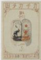
【天啓創造】1907年 油彩、カンヴァス 縦17×横13.2cm 京都市立美術館蔵