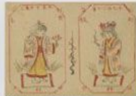
【白樺】1917年 油彩、紙 縦28.1×横23.2cm 京都市立美術館蔵