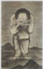
【天啓創造】1907年 油彩、カンヴァス 縦17×横13.2cm 京都市立美術館蔵