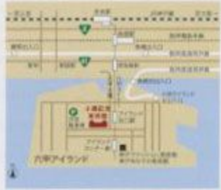
美術館の地下に有料の自転車駐車場があります。