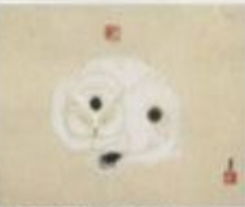
【白顔】1926年 油彩、カンヴァス 縦27×横27.2cm 京都市立美術館蔵