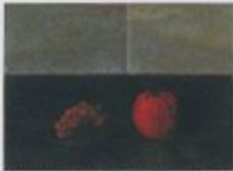
【赤黒】1926年 油彩、紙 縦28.1×横23.2cm 京都市立美術館蔵