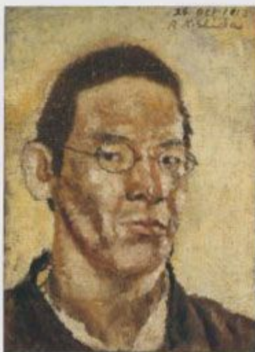
【肖像画】1913年 油彩、カンヴァス 縦44×横33.2cm 京都市立美術館蔵

京都市立美術館のコレクションの中から、油彩、水彩、東洋、日本画、装丁画、版画、陶器そのほか、岸田彌生(1891-1929)の作品及び資料120余点を紹介いたします。