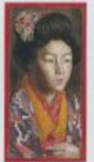
【美人】1915年 油彩、カンヴァス 縦47×横31.2cm 京都市立美術館蔵