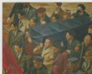
大月謙二「吾等」1929年 山本堂立美術館蔵