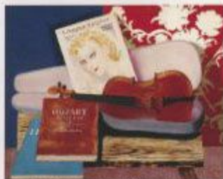
高野三三「ヴァイオリンのある静物(コンポジション)」1927年 山本堂立美術館蔵