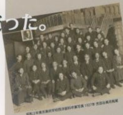
昭和2年東京美術学校西洋画科卒業生写真 1927年 大田山美術財団蔵