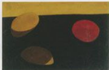
山口眞吾「三ツノ円A」1949年 豊田美術館蔵