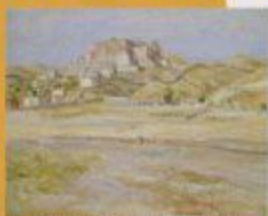
岡田謙三「ラマサ」1941年 神奈川美術館蔵