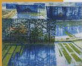
大田清太郎「五月の生草園」1973年 個人蔵