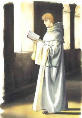
「修道士ファルコ」Chapter 4 扉絵「プロデ」2010年5月号