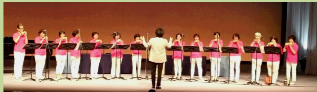
♪オカリナフェスティバル 8月25日文化ホール♪ 演奏するオカリナクラブのみなさん。輝いていますね。