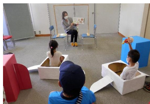
(右) ソーシャルディスタンス号