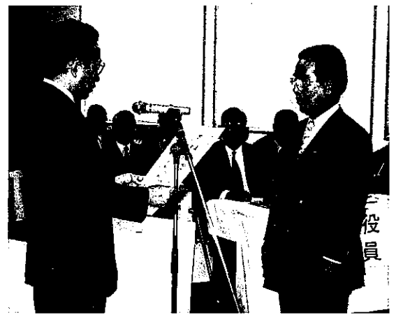
永年建築協定地区表彰