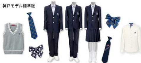
シャツ・ネクタイなど学校によって採用する品目が異なる場合があります。