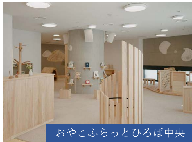
おやこふらっとひろば中央