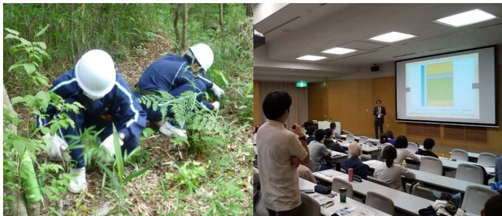
KOBE学生地域貢献スクラム (里山の整備と環境体験学習、神戸みらい学習室)