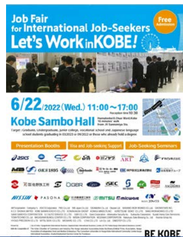
外国人向け合同企業説明会