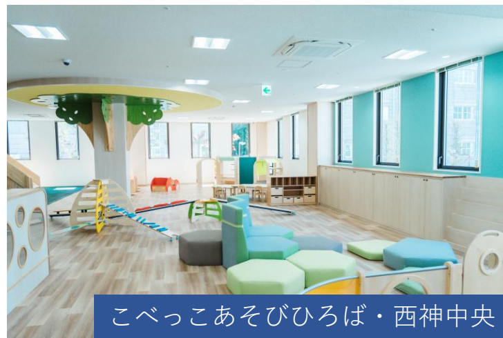
こべっこあそびひろば・西神中央