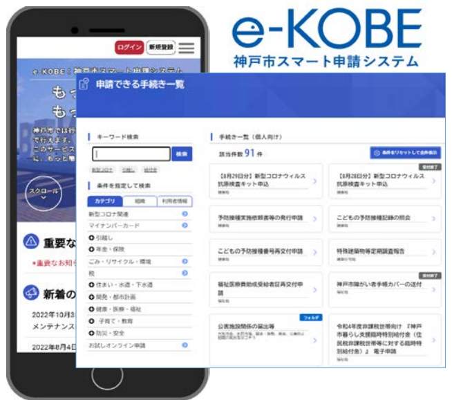
スマート申請システムe-KOBE