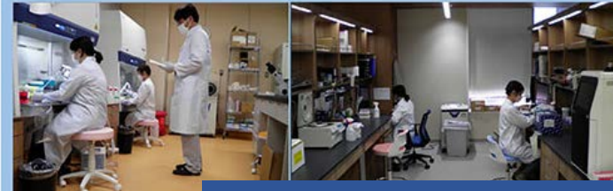
医療産業都市推進機構 (感染症制御研究部)