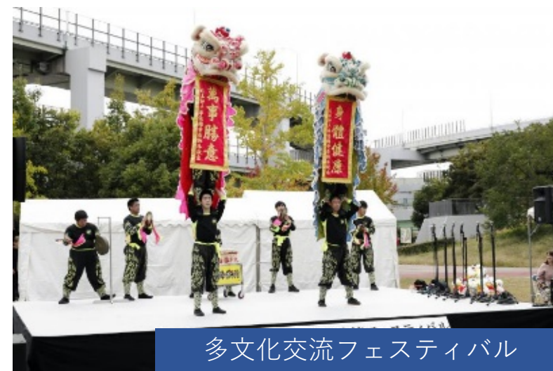
多文化交流フェスティバル