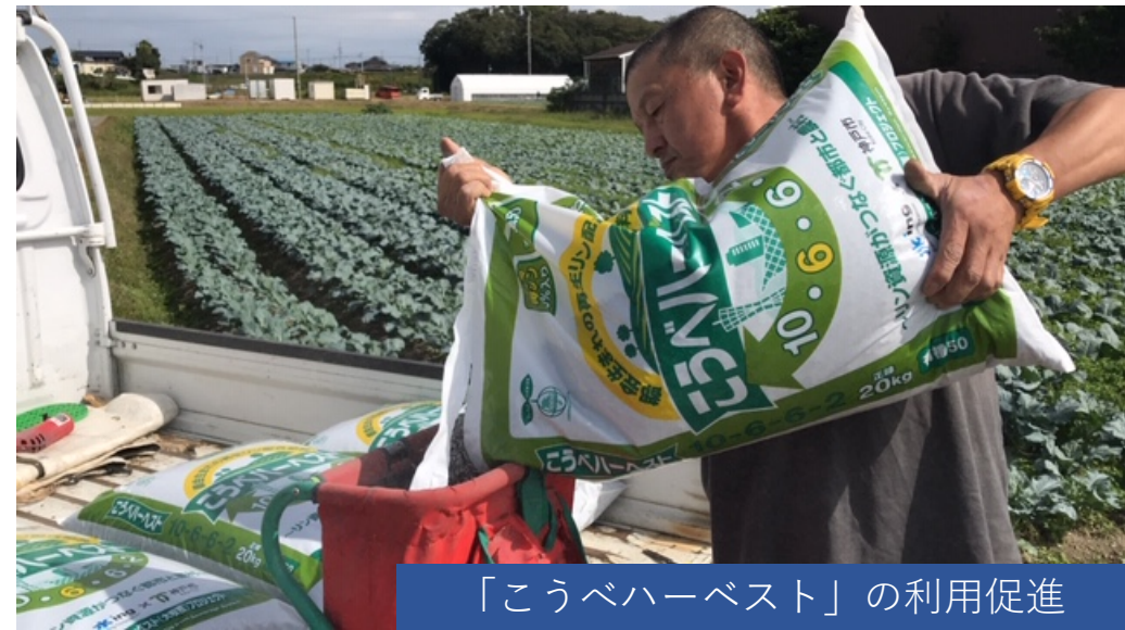
「こうべハーベスト」の利用促進