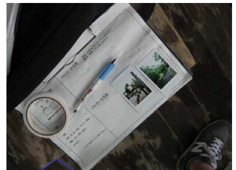
作成したパトロールカ ード。 右の写真はパトロール 隊のバッジ。