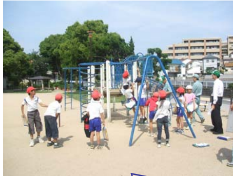
実際に遊具に乗って点検!