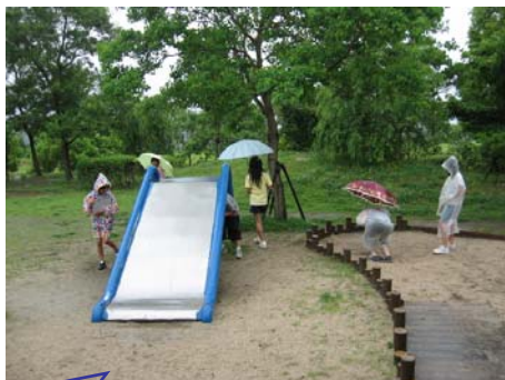
傘をさしたり、レインコ ートを着ての点検