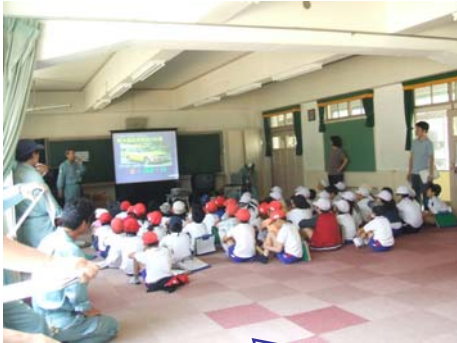
まず点検の説明を受けます

総合学習「交通安全総点検」のなかで、学校の近くでルートを決め、道や公園の点検を垂水警察や垂水建設事務所と一緒に実施しました。学校の近くでいつもの身近な場所での点検は新しい発見になったようでした。