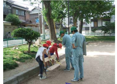
あー! 板が! 危な