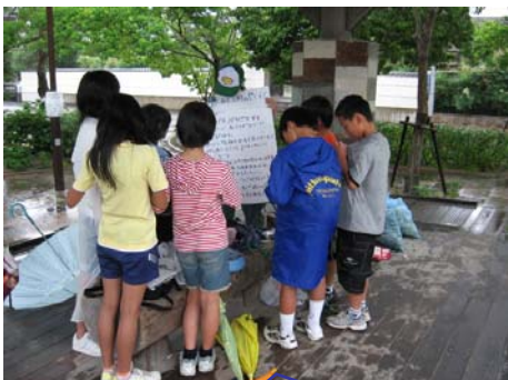
公園で遊ぶときの約束 ことを学びます。

総合学習の時間で、公園パトロール隊を結成し、その場で写真を撮ってパトロールカードを作成しました。子どもが自分たちで気をつけなければならないことの学習も同時に実施しました。あいにくの雨でしたが、子どもたちは一生懸命点検しました。