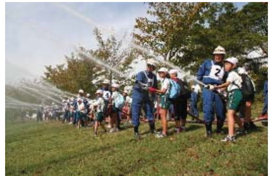
安全安心体験学習

また、各地域のジュニアチームの活動を支援するとともに、活動内容などについて相互に情報交換を行い、各チームの活動の充実を図ります。あわせて、区内全域での結成をめざし、地域への取り組みを行います。