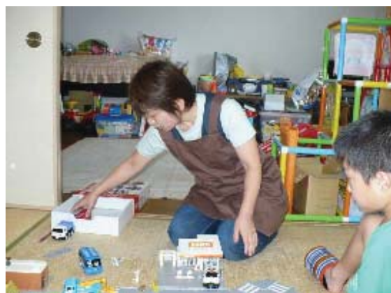
子どもと親の応援隊

乳幼児健診の機会を活用するとともに、発達障がい児が通う学校・園との連携を密にすることにより、発達障がい児の早期発見に努めます。あわせて児童委員などが地域の見守りを行い、相談に応じます。また、発達障がい児の支援に取り組むNPOや地域団体と協働して、地域における「子どもと親の応援隊」の継続的な取り組みを進めます。