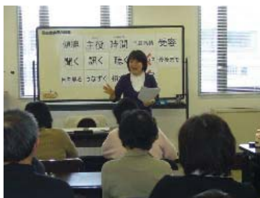
ボランティアの育成支援

高齢者層を中心とした地域住民に対してボランティア講座を実施し、ボランティアグループの結成を進め、その後の継続した活動を支援します。