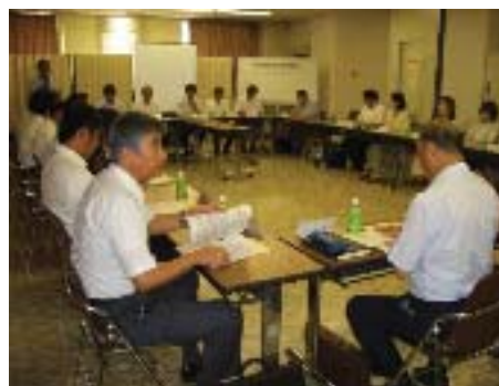
西区感染症対策連絡会

専門機関や教育・福祉関係施設など多方面からの参加のもとに立ち上げた「西区感染症対策連絡会」を基盤として情報共有ネットワークの拡充と連携強化を図り、感染症発生の早期探知および拡大の抑制に努めます。