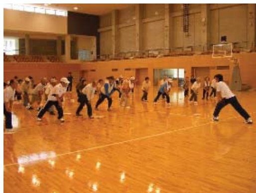
ヘルシーウォーキング研修会

生活習慣病の予防には継続的なウォーキングが効果的です。広く啓発活動を行うとともに，ウォーキンググループを育成し，住民主体の健康づくりを進めます。