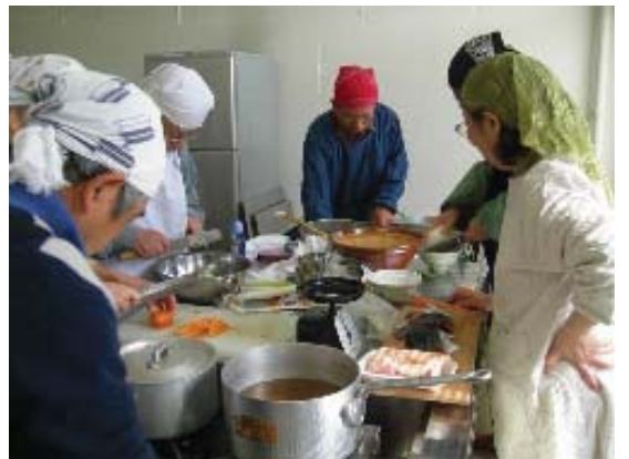
食による健康づくり

健康づくりのためには、運動や休養とともに「食」が重要な要素となります。栄養相談や早寝早起き朝ごはん運動などによる食生活習慣の改善、給食会、ふれあい喫茶などの場を利用した助言、指導を行い、「食」を通じた健康づくりを推進します。