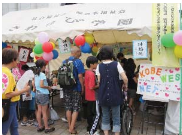
KWNはっぴ〜カーニバルでの啓発活動

KWNの事業を支援し、障がい者が安心して地域で生活できるよう、福祉施設との連携を深めるための協議や研修、啓発事業などを実施するため、関係事業所と地域との結びつきを強めます。