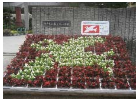
小学校での花絵花壇づくり

区内の小学校で、西区産の花壇苗を使用した花絵花壇づくりに取り組みます。また、まちなかの公園や街路などでの飾花を進め、花にあふれる潤いあるまちづくりをめざします。