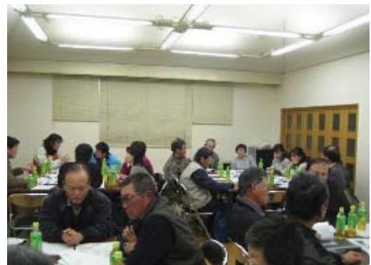
里づくり計画策定会議

里づくり活動の中で，都市部商店街と農村との交流などの地域間交流や各地域の特産品づくりといった魅力アップに繋がる取り組みに対して支援を行います。また，地域単位で取り組んでいる希少生物の保護活動については，ホームページなどを通して，その取り組みを広報します。