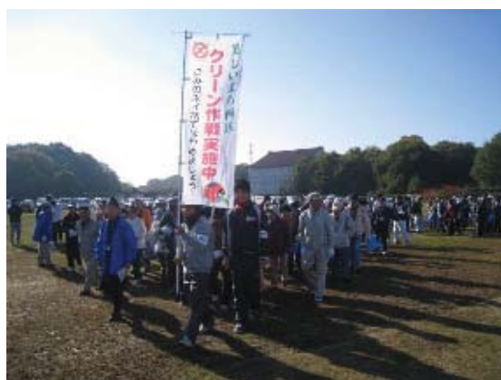
地域主体のクリーン作戦

地域活動としてクリーン作戦を実施し、暮らしに身近な地域の美化に努めます。住民主体の美化活動については、ごみの出し方・マナーの周知を図るほか、資材の提供などを通して活動を支援します。