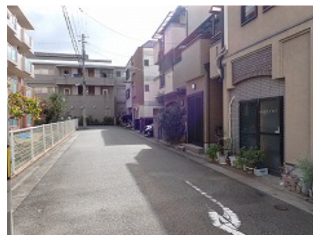
3階建てや道路際ギリギリに建築された建物による街並み