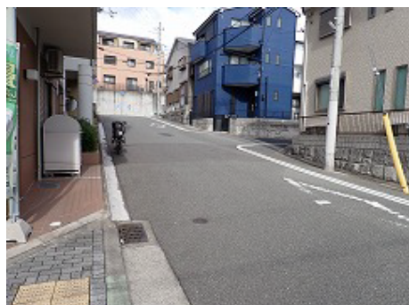
登り坂に沿って並ぶ建物