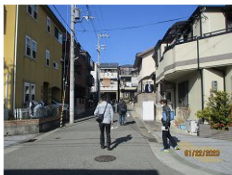
生垣や庭木など、各宅の緑が少ない街並み