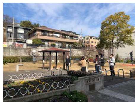
鈴蘭台北町に計画されている公園規模に近い松本うめ公園