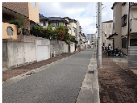
道路を挟んで高低差がある場合の街並み（駐車場分の差）