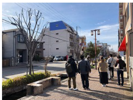
松本線を歩いてみました

松本地区は、神鉄湊川駅から西へ徒歩3分ほどです。鈴蘭台からも行きやすい場所にありますので、ご興味のある方は、ぜひ一度訪ねてみてください。